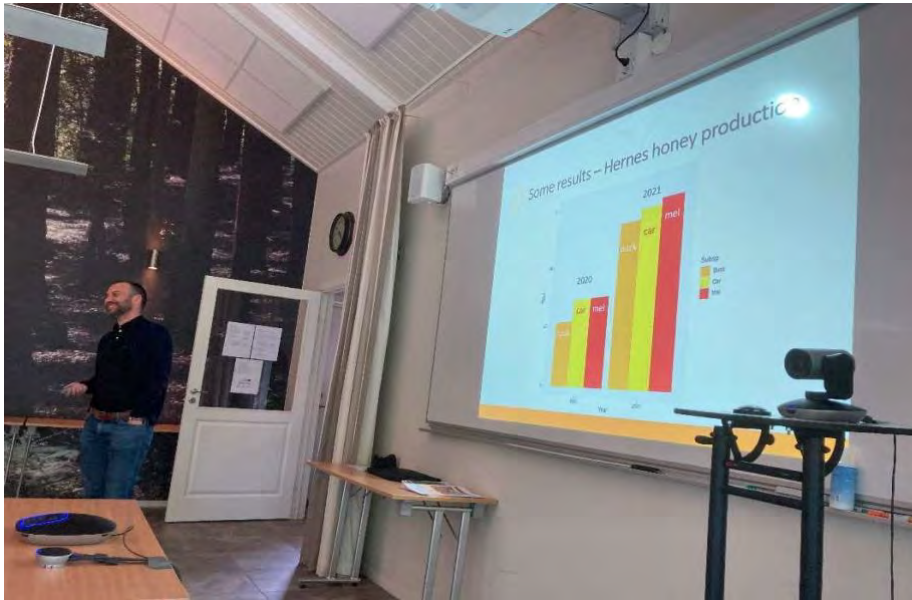
Bild 5 En av många föreläsningar på INTERREG Bee Research Conference