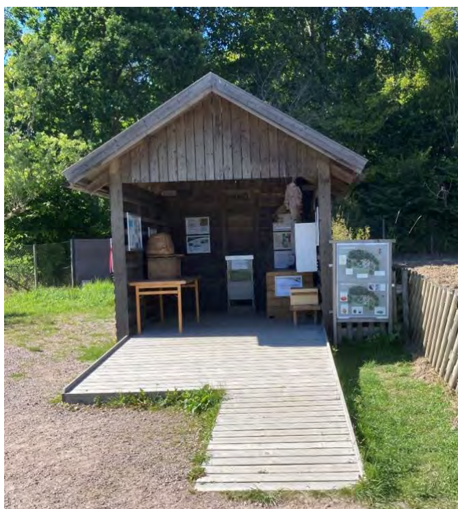
Bild 7 Den tillgänglighetsanpassade demonstrationskupan på Nordens Ark.

Vidare har 2019 en handikappanpassad demonstrationskupa byggts upp som visar binas aktivitet i kupan genom att ena sidan på kupan är täckt med glas. Där finns även information om bins biologi och biodling samt INTERREG-projektets aktiviteter. Demonstrationskupan har setts av över en kvarts miljon besökare under projektperioden (Bild 7).