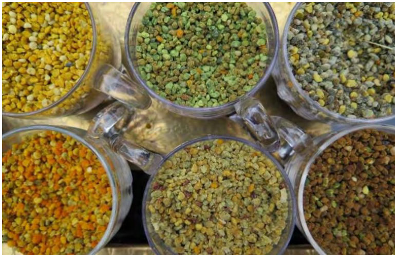
Bild 4 Exempel på färgskillnader på pollen från olika kupor/samhällen.

Analyserna av pollenproverna från Juoksengi vid polcirkeln är klara. I dessa varierade Evenness i prover från ett och samma insamlingstillfälle mellan olika bisamhällen som tillhörde samma underart. Variationen var minst hos subsp. mellifera . Vidare visade våra resultat att mellifera-samhällen koncentrerade sig på att samla pollen från några få växtarter i början av säsongen, men inkluderade fler pollenkällor från midsommar och framåt. Totalt samlade subsp. A.m. mellifera in pollen från cirka 30 olika växtarter, där några få dominerande, t ex älggräs, videarter och hallon. Hos denna underart var Evenness aldrig högre än 0,8, medan måttet vid flera tillfällen närmade sig 1 i prover från samhällen som tillhörde de andra underarterna. Sådana värden nåddes i första hand före midsommar hos hybriderna Buckfast och hos underarten A.m. carnica , medan Evenness var lägre i samtliga prover från dessa underarter under den senare delen av säsongen. Det verkar alltså som att subsp. mellifera fungerade som en jämförelsevis mer fokuserad och stabil pollensamlare över den korta växtsäsongen vid polcirkeln än vad de andra underarterna gjorde. Buckfastbin som med sin hybrid-bakgrund har en mer varierande genetik, tycks inte ha någon specifik strategi, och samlade från olika växter under sina insamlingsturer.