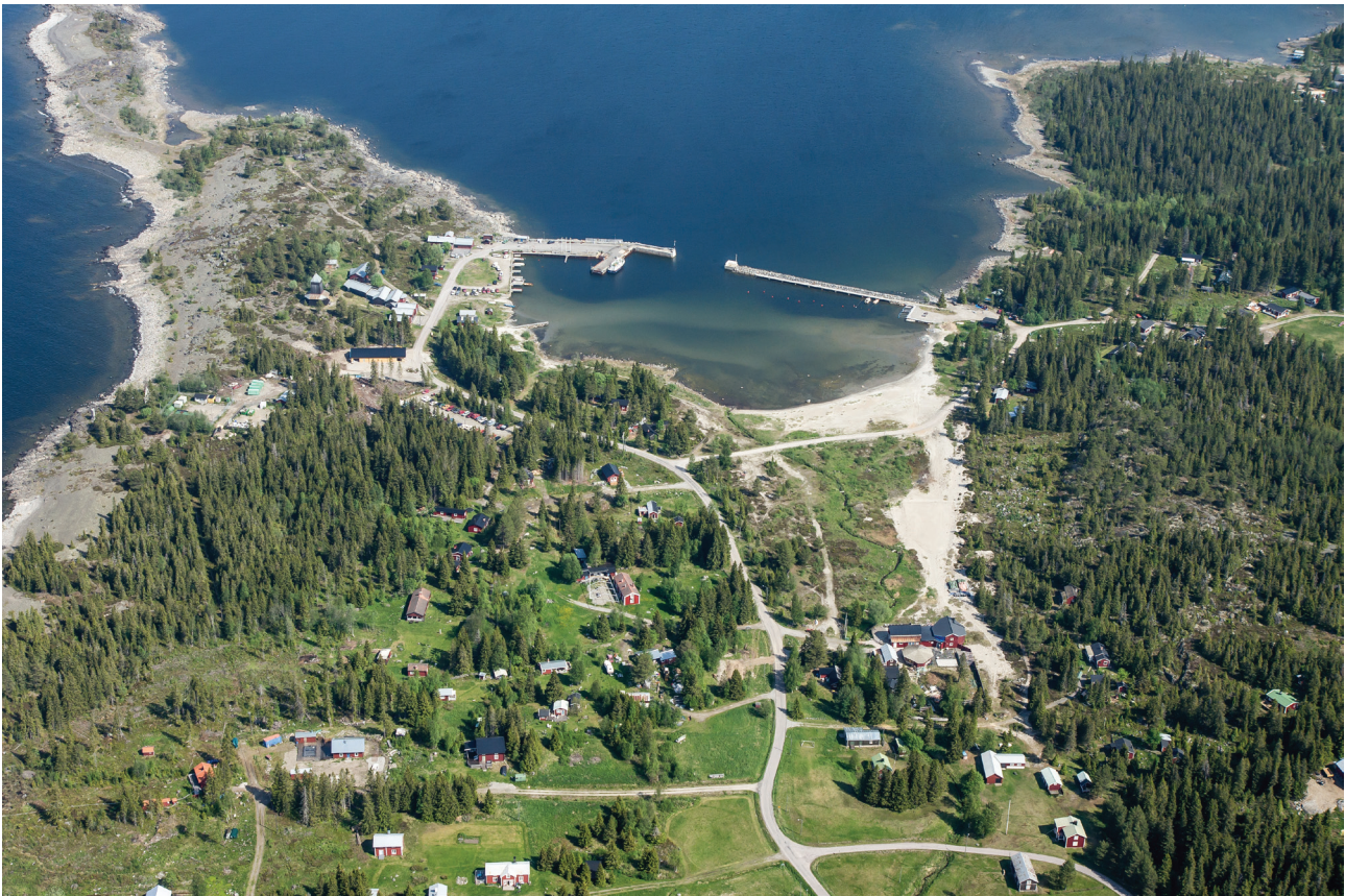
Byviken norra Holmön