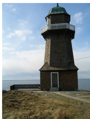
Berguddens fyr är statligt byggnadsminne.