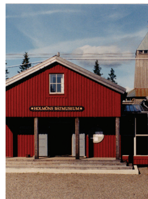
Holmöns båtmuseum har byggts och drivs av ideella lokala krafter.