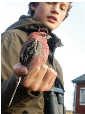
St Fjäderägg är kulturmiljö av riksintresse. Här finns också vandrarhem och en fågelstation.

Holmön har goda möjligheter att erbjuda olika former av natur- och ekoturism men har också stor potential för andra former av besöksaktiviteter (kulturreseor, konferenser m.m.). Förutom förbättring av de osäkra och glesa kommunikationerna (buss, färja) skulle Holmön behöva en starkt kapacitet för övernattnig med gängse hotellstandard. De vandrarhem som finns är utmärkta och passar väl för sina målgrupper, men vill man nå bredare skikt av besökare måste det vara möjligt att erbjuda övernattnig med högre standard.