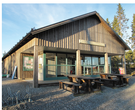
Öns nya affär invigdes år 2011 i sitt nya läge nära hamnen.

På Holmön finns ett äldreboende. Skolan stängdes år 2010 på grund av för litet elevunderlag.