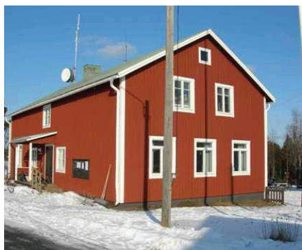
Öns skola stängdes år 2010.