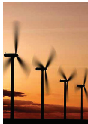
Diskussioner pågår om etablering av vindkraftpark på Holmön och Ängesön.

Om tillstånd ges kan vindkraftsparken börja byggas tidigast 2014-2015. En vindkraftetablering skulle kunna bidra till att Holmön förses med fast bredband för IT-kommunikation. Optiska fibrer kan integreras i de kraftkablar som ska leverera energin till stamnätet. För all verksamhet som bedrivs på Holmön är en väl fungerande färjelinje av betydelse. För vindkraftsprojektet skulle en uppgraderad färja betyda mycket för möjligheterna att bedriva en rationell verksamhet, inte bara vid investerings- och etableringstillfället utan kanske änmer under den därpå följande löpande driften.