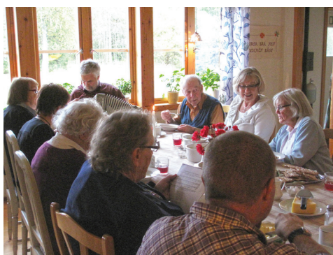
Landshövdingen på besök på öns äldreboende.