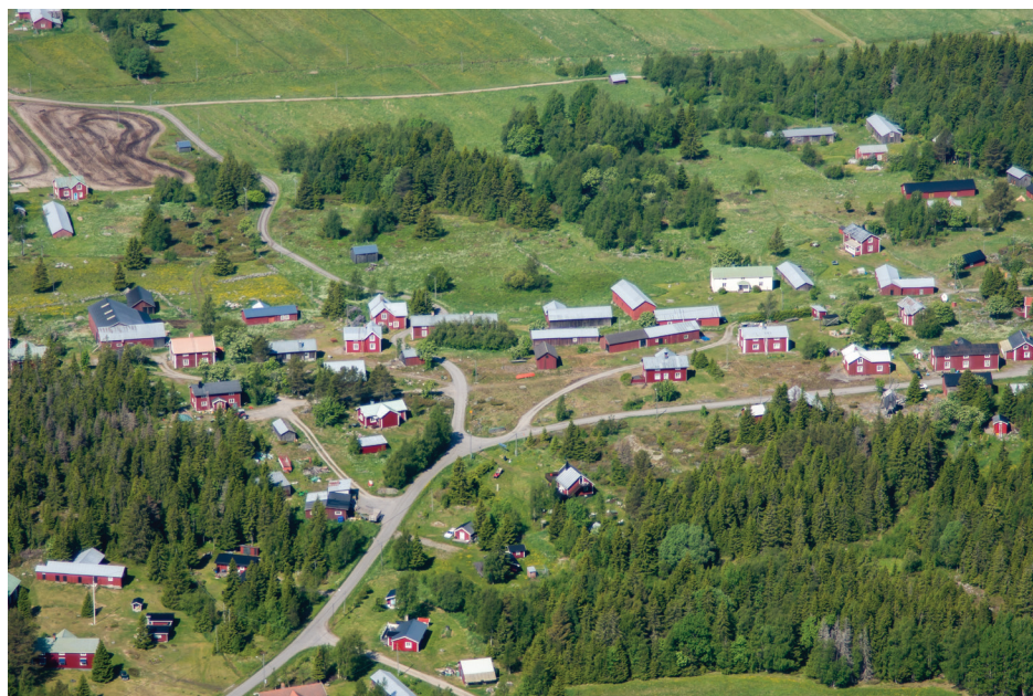
Holmöns bykärna är kulturmiljö av riksintresse.