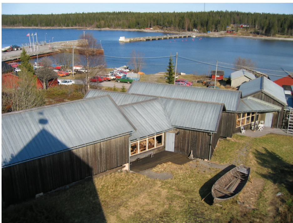
Holmöns båtmuseum och Byviken.