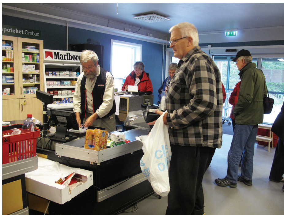
Affären är öppen året om och en viktig mötesplats.