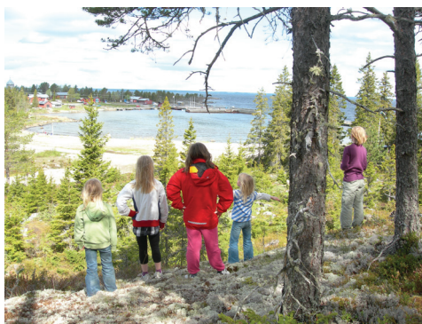
Skolbarnen går numera skola i Sävar.