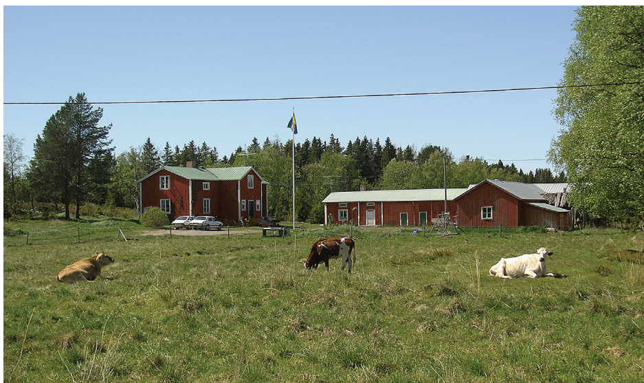
Holmöns kulturlandskap är beroende av att marker hålls öppna.