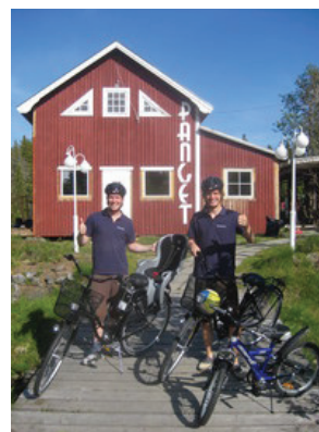
Högre kvalitet och ökad kapacitet gällande boende samt marknadsföring är exempel som skulle bidra positivt för främjande av besöksnäringen på Holmön.