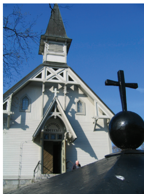
Kyrkan är kyrkligt byggnadsminne.